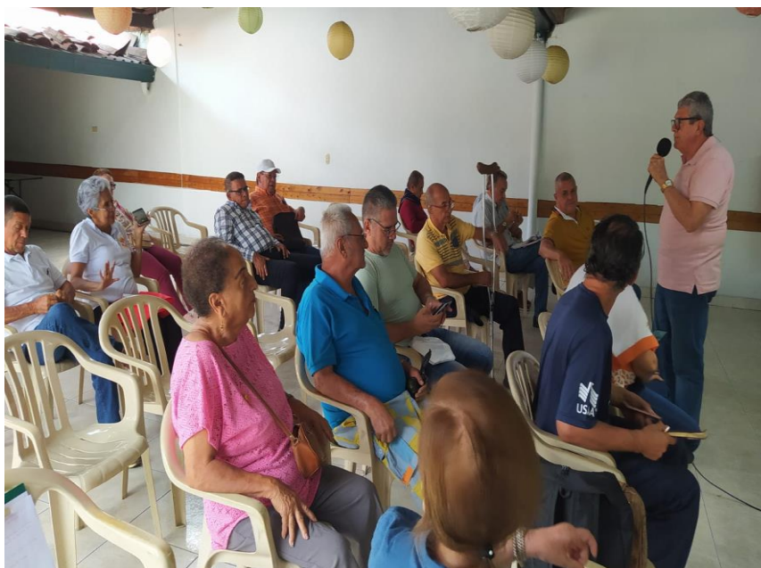
Foto 1. Asistentes al espacio participativo MESA DE LA SALUD de Palmira de fecha 13/03/2025